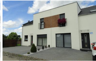
Dąbcze ul. Cyprysowa, ul. Modrzewiowa