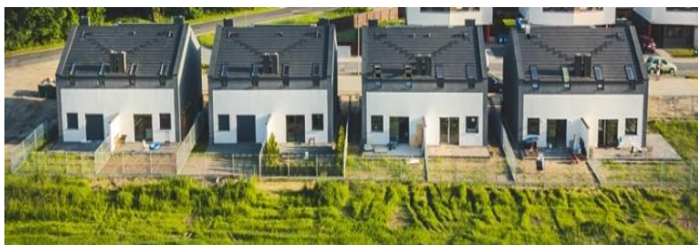
Wrocław ul. Gromadzka