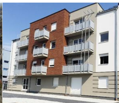
Leszno ul. Poplińskiego