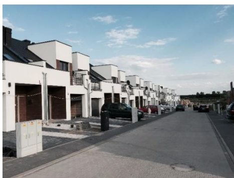
Lubin ul. Szymanowskiego,