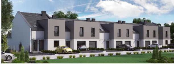
Świąciechowa ul. Warzywna